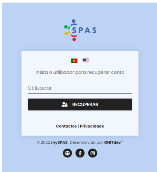
Figura 2 - Página de Recuperação de Conta

No primeiro acesso à plataforma, será necessário definir a palavra-chave que irá utilizar. Para isso, deverá clicar no link “Recuperar palavra-chave” (figura 1), que o(a) irá redirecionar para a página de recuperação de conta (figura 2).