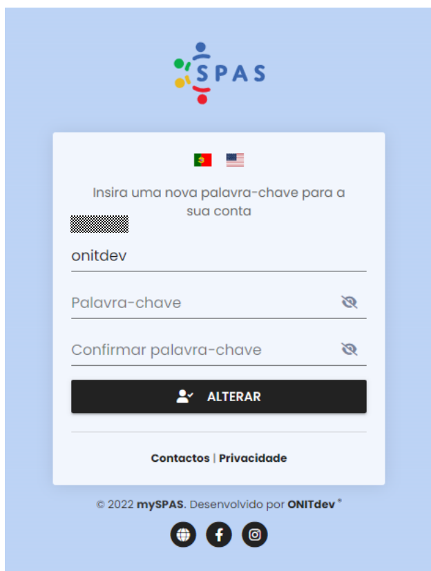
Figura 4 - Página de Redefinição de Palavra-Chave

Finalmente, deverá clicar em “Alterar” , ao que deverá surgir uma confirmação da alteração da palavra-chave (sinalização verde em caso de sucesso no fundo da página).